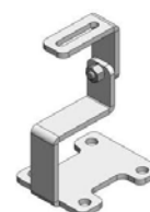
Salvatejas estándar de 85 mm. Disponibles de 50 y 70 mm.